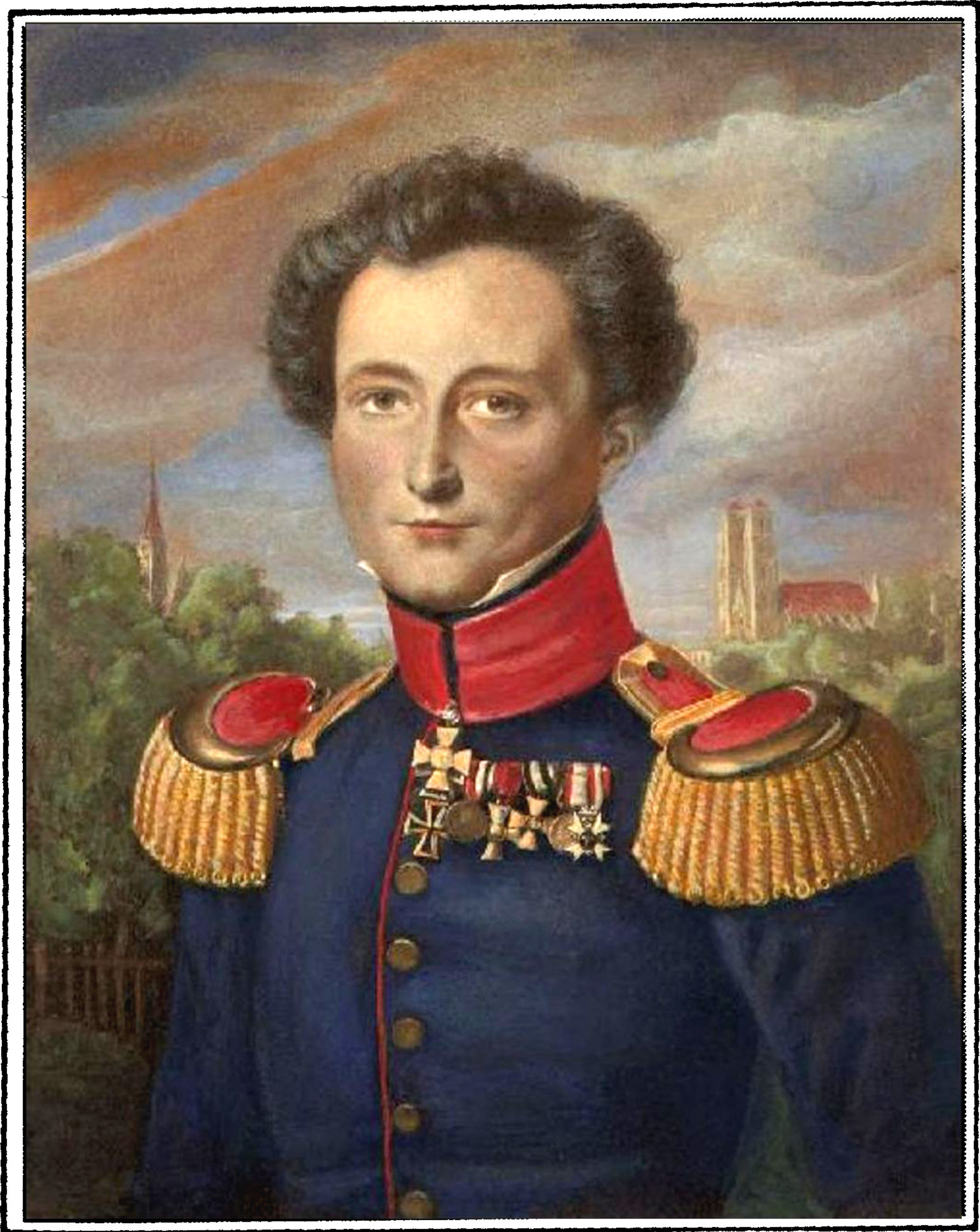
GENERAL CARL VON CLAUSEWITZ